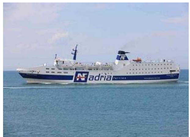
Unser Fährschiff Dürres - Ancona