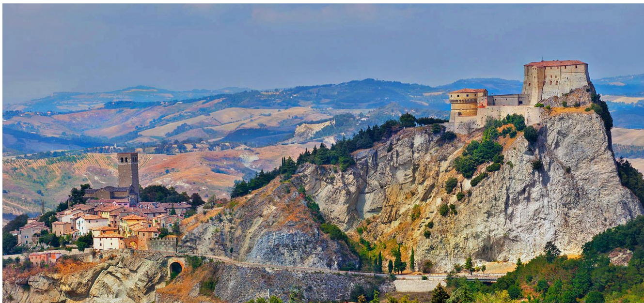
San Leo, eines der schönsten Dörfer Italiens

über die Valmarecchia. Mittagessen in einer weiteren typischen Trattoria mit Spezialitäten aus der Romagna, Abendessen im Hotel